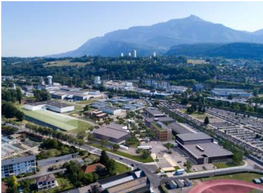
Maquette Les Fontanettes, image virtuelle